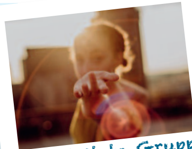
...angeleitete Gruppe für Betroffene