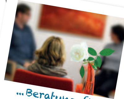
...Beratung für Angehörige