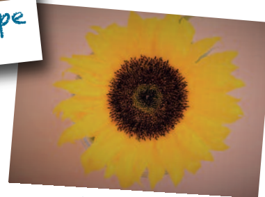
...Gruppe für betroffene Eltern